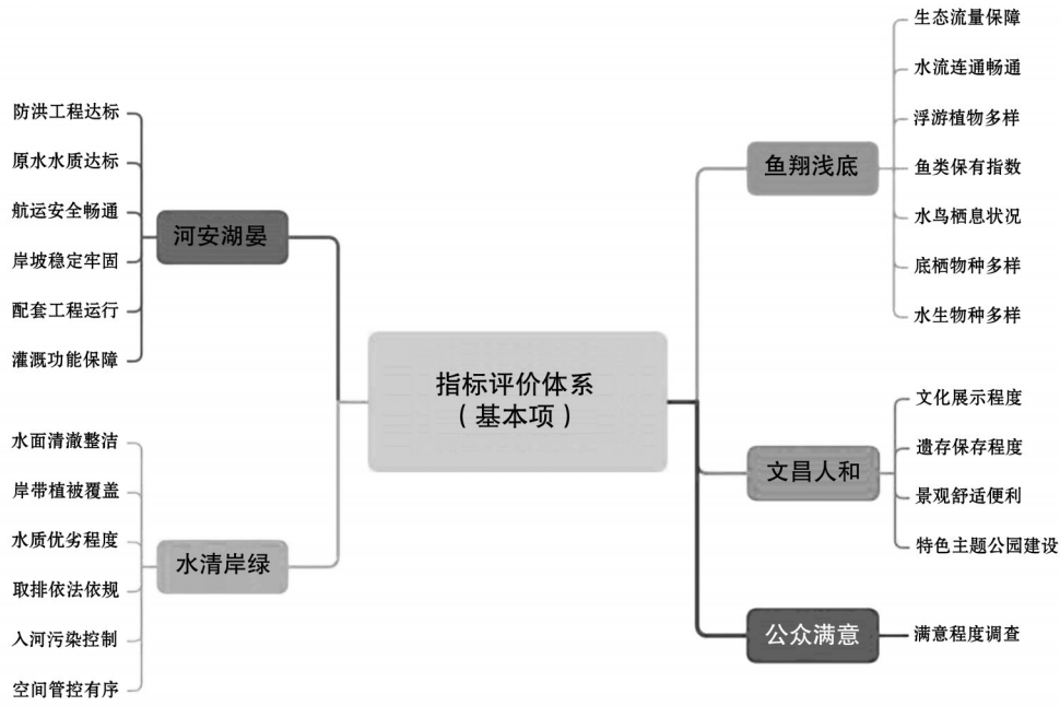
图1 指标评价体系(24个基本项)(以河道为例)